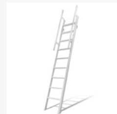
金属製ロフトはしご