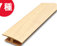
T型床見切 3,780円 (税込)