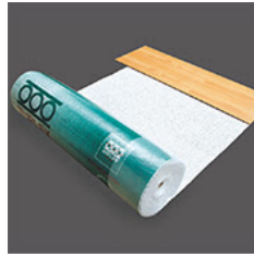
テュプレックスシート 12,960円 (税込)