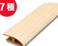
段差見切 3,780円 (税込)