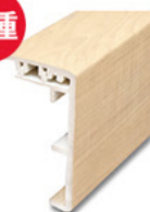
上り框 9,396円 (税込)