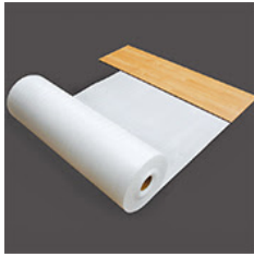
クッションシート 5,400円 (税込)