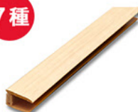
L型床見切 2,916円 (税込)