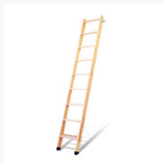
木製ロフトはしご