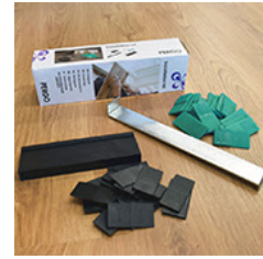
施工キット 3,780円 (税込)