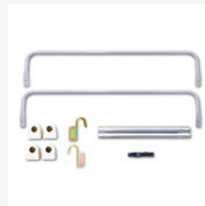
ロフトはしご用金具